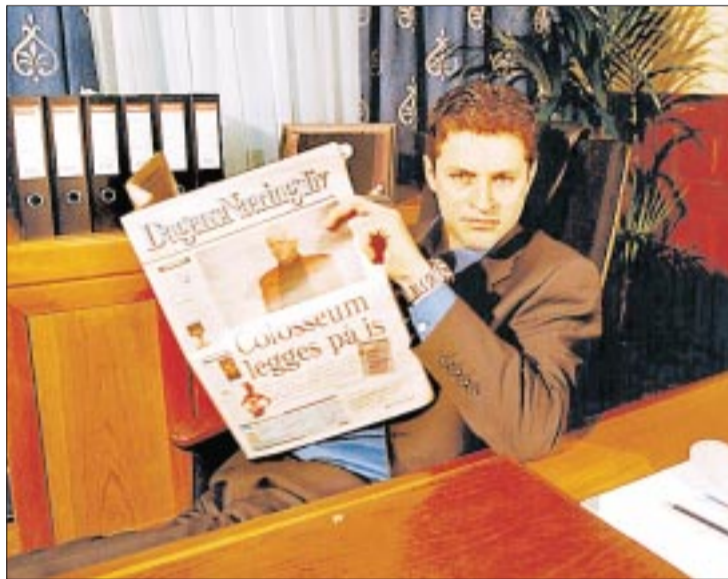
Drittsekk? Direktør Rolfi «Hotel Cæsar» holder seg i det minste oppdatert.

Dette betyr ikke at mediene er uviktige, bare at deres rolle misforstås. Premisset for denne og tidligere panikker er at dårlighet i mediene imiteres kritikk-løst, altså at mediene injiserer sitt innhold i forsvarsløse hoder. Slik er det ganske enkelt ikke. Alle, barn inkludert, har moralske og andre forutsetninger for å tolke og vurdere mediens innhold kritisk, selv om disse forutsetningene varierer med alder og ulikt distribuerte kulturelle ressurser. Tilegnelsen av tv foregår ikke i et vakuum, men i en sosial kontekst som inkluderer både nære relasjoner og offentligheten. Offentlig diskusjon kan derfor, om ikke overspill ødelegger, bidra til at deler av tv-tilbudet betraktes med styrket kritisk sans der